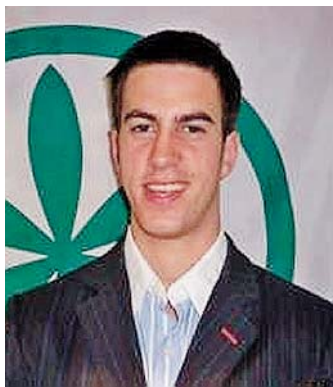
IL CONSIGLIERE Stefano Bargi

La ventilata chiusura dell'Ufficio agricolo di Sassuolo, che funge da sportello anche per i territori dei comuni di Formigine, Maranello, Fiorano, Prignano, Palagano, Montefiorino e Frassinoro, è oggetto di un'interrogazione presentata da Stefano Bargi, consigliere regionale della Lega nord.